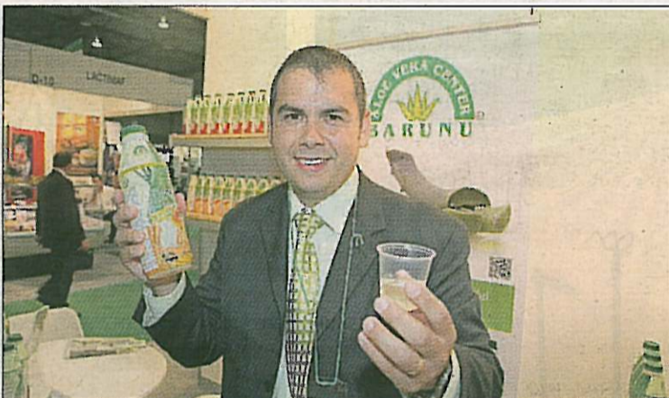
El refresco puede adquirirse en el stand de Barunu.

un precio de unos 30.000 euros, en el caso del detector de fuegos forestales, y de 20.000 euros en el pensado para áreas industriales.